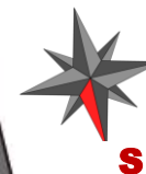
SCHEMA OBJEKTU BD AB